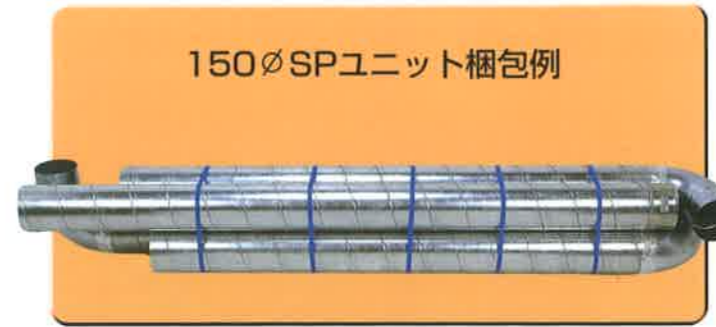
150φ SPユニット 梱包例

各部屋ごとに梱包されますので、現場での搬送性に優れ、仕分作業も大幅に低減されます。またコンパクトにしたユニット梱包ですので保管スペースが少なくすみます。