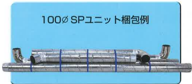
100φ SPユニット 梱包例